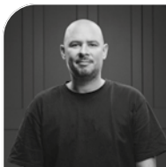
Hannes Zwetschke Agentur Zwetschke