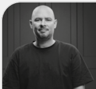
Hannes Zwetschke Agentur Zwetschke